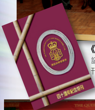
《40週年紀念特刊》出版 記載40年來會務發展的紀念特刊同日出版。