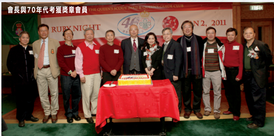
會長與70年代考獲獎章會員