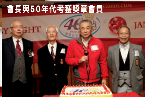
會長與50年代考獲獎章會員