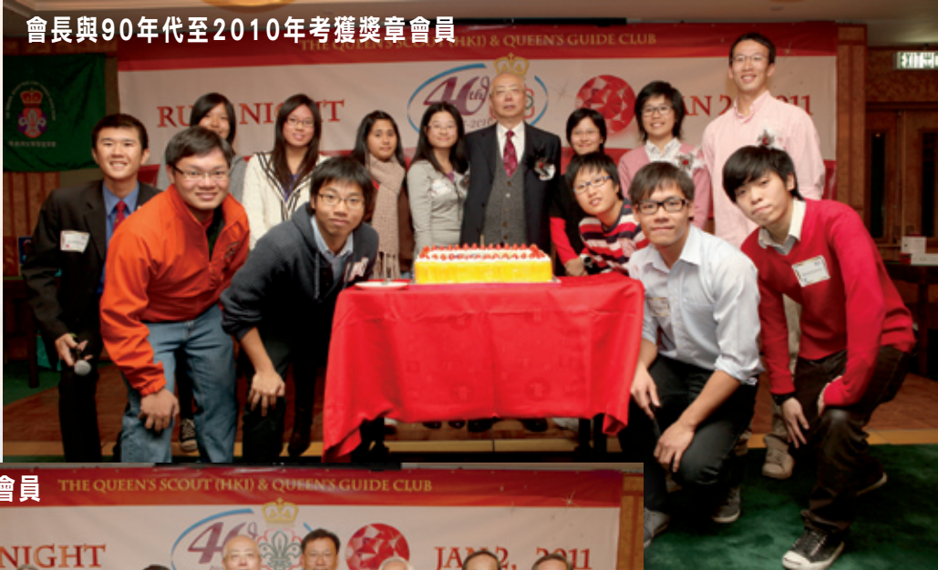
會長與90年代至2010年考獲獎章會員