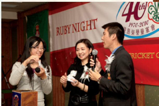
晚宴餘興節目：合唱童軍歌曲及抽獎