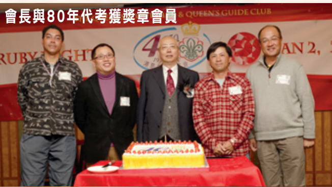
會長與80年代考獲獎章會員