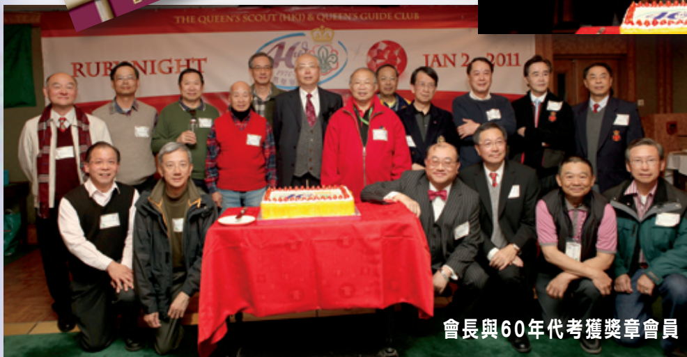
會長與60年代考獲獎章會員